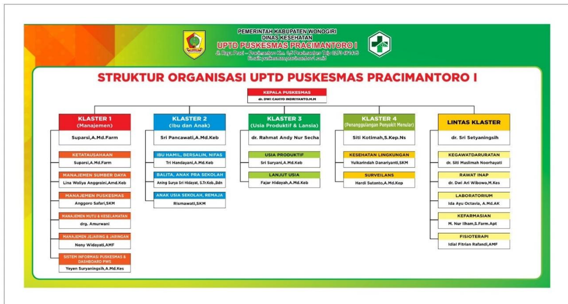
Gambar 4.1 Struktur Organisasi dan Tata Kerja UPTD Puskesmas Pracimantoro I